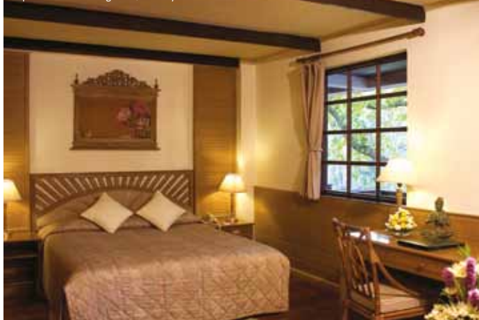
Imperial Mae Hong Son, Honeymoon Suite